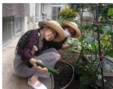
取れました！ まずは1本