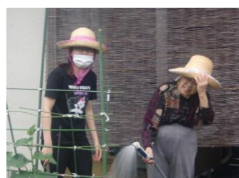
水やりをしてくれるご利用者様も いきいきとしています