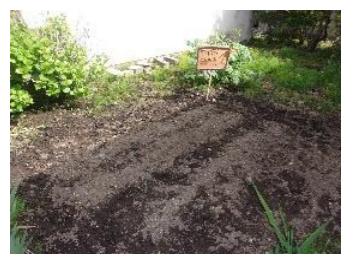
始まりはこんな感じでした