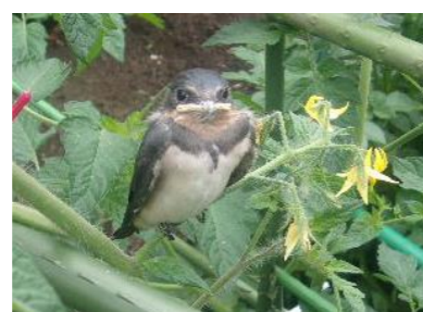
珍客。つばめの子どもが 飛び立つ練習中 この子は怖いのか、ジッと したまま動きませんでした ごめんね・・・頑張って！！