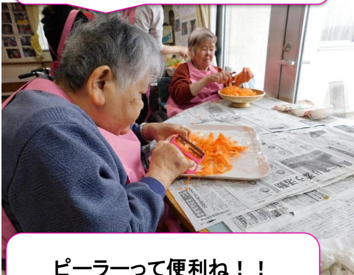
ピーラーって便利ね！！ スルスル皮むきできちゃうわ～