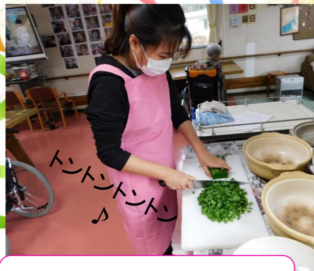
誰が早く出来るかな？！