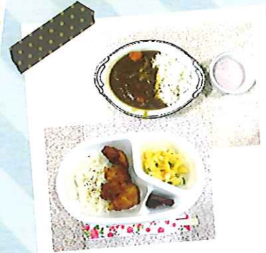
ホームタウン宝木特製の 夕食が出ます