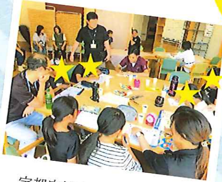
宇都宮協立診療所の 医師も参加して 宿題を見ています