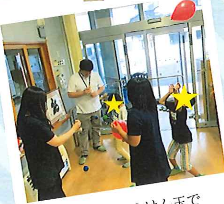
風船やけん玉で 遊んだりもします

地域住民の方、学生さん (ボランティア証明書発行 します)、興味のある方なら どなたでも大歓迎！